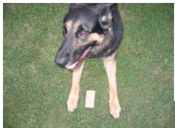
Korrektes Verweisen Bewertung: Vorzüglich

Neu: Das Verweisen der Gegenstände hat direkt und in Richtung der Fährte zu erfolgen. Leicht schräges (bis 30 Grad) Sitzen, Liegen oder Stehen zum Gegenstand ist nicht fehlerhaft. Es ist auch nicht fehlerhaft, wenn der Hund, sofern er in seiner Position bleibt, in die Richtung des HF zurückschaut. Der Hund muss zeigen, dass er verweisen will und nicht, dass er es muss. Die Position des Gegenstandes beim Verweisen ist direkt vor oder zwischen den Vorderpfoten. Es ist nicht gefordert, dass der Hund den Gegenstand fixiert (anstarrt). Der Hund muss ruhig und ohne Stress oder Meidungssignale in seiner Position bleiben, bis er wieder angesetzt wird. Beim Wiederansatz befindet sich der HF aufrecht neben oder direkt hinter seinem Hund.