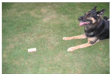
Dichter Verweisen Bewertung: gut