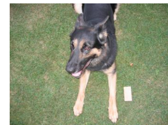
neben den Pfoten Bewertung: sehr gut