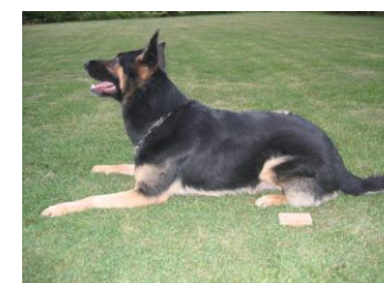
neben dem Gegenstand Bewertung: Mangelhaft