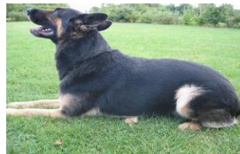
Auf dem Gegenstand Bewertung: befriedigend