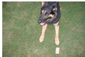
Direkt vor den Pfoten Bewertung: noch Vorzüglich